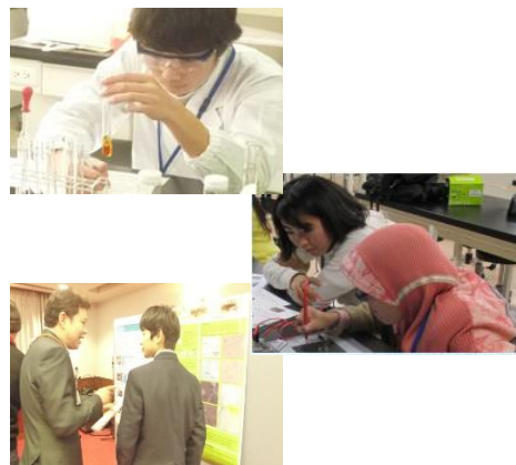
成果報告会の様子